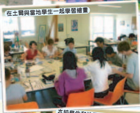
在土爾與當地學生一起學習繪畫