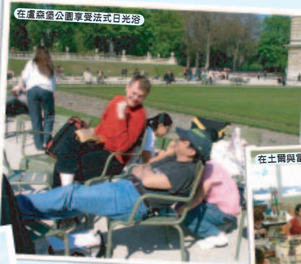
在盧森堡公園享受法式日光浴