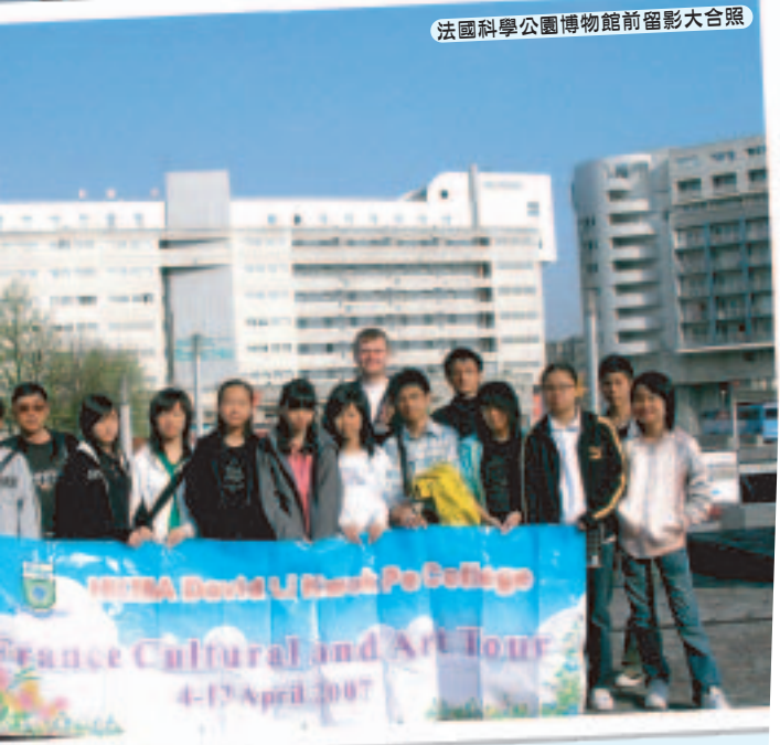
法國科學公園博物館前留影大合照

最後總結今次活動，我感謝各家長對學校和領隊老師的支持和信任，藉今次的旅程，老師和學生除了加深了彼此的認識和了解外，我發現同學們對法國的風土人情認識增加了不少，亦在法國結交了一些朋友，相信他們因而對於自己未來的學習會更能確立目標，甚至有同學表示有興趣出國留學等。希望在不久的未來我仍然有機會和同學一同出外一學習。