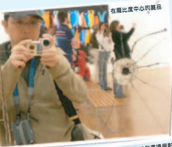
在龐比度中心的展品