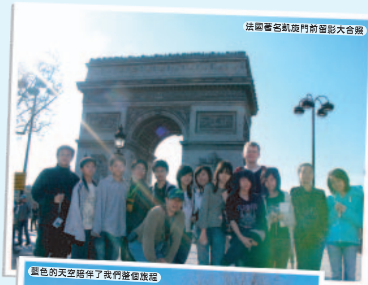
藍色的天空陪伴了我們整個旅程