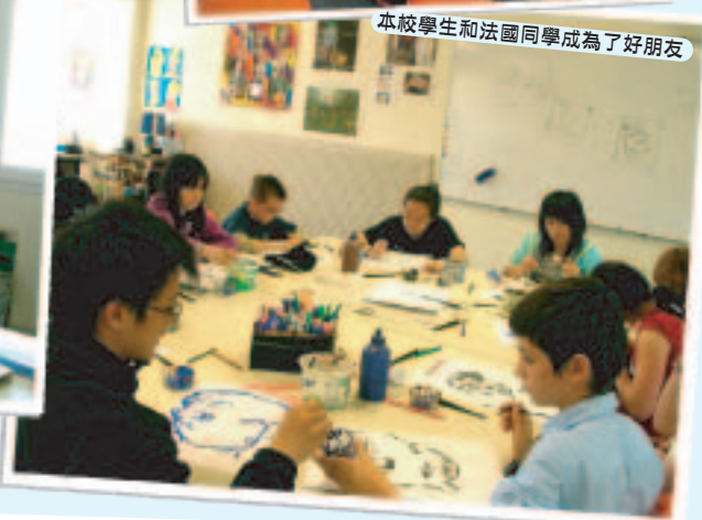
本校學生和法國同學成為了好朋友