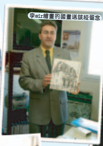
李sir繪畫的國畫送該校留念