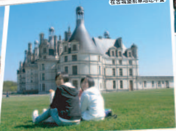
在古城堡前草地吃午餐