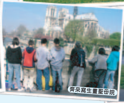
齊來寫生畫聖母院