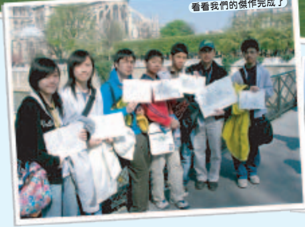
看看我們的傑作完成了